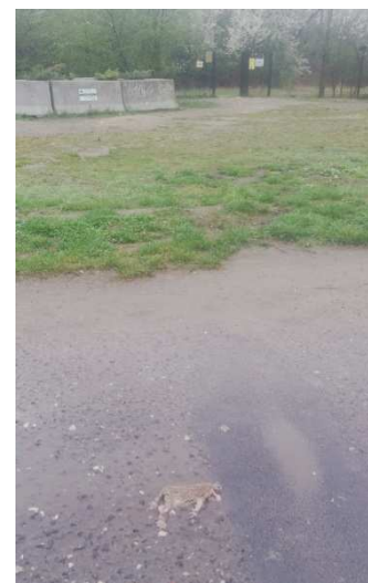
Fot. 1. Rozjechana ropucha szara Bufo bufo . Ul. Wyłom, 07.04.2019.

Niemal połowa (27 os.; 45% wszystkich) płazów zanotowanych w trakcie badań zaliczała się do osobników martwych lub ciężko rannych, najechanych pojazdami (kołami rowerów, skuterów, motocykli lub samochodów). Należały one do dwóch gatunków chronionych: traszki grzebieniastej i ropuchy szarej (Fot. 1). Szczególnie często ofiary drogowe notowano wśród ropuch szarych – aż 58% wszystkich stwierdzonych ropuch zaliczało się do tej grupy. Nieco tylko mniejszy udział osobników martwych lub rannych (38%) stwierdzono u traszki grzebieniastej. Na Ryc. 2 przedstawiono lokalizacje miejsc, w których w trakcie badań stwierdzono osobniki płazów, w tym osobniki żywe i martwe lub ranne. Na rysunku tym widać, że w okresie migracji niemal na całym biegu ul. Wyłom można spotkać chronione gatunki płazów. Niemniej jednak można wyróżnić odcinki, na których zgrupowane są punkty (miejsca stwierdzeń) i które są szczególnie często wykorzystywane przez migrujące płazy. Są to jednocześnie odcinki, na których najczęściej notowane są ofiary drogowe. Należy nadmienić, że na badanym odcinku drogi pod kołami pojazdów giną nie tylko płazy, ale także drobne bezkręgowce (np. chrząszcze z rodziny biegaczowatych i lądowe ślimaki).