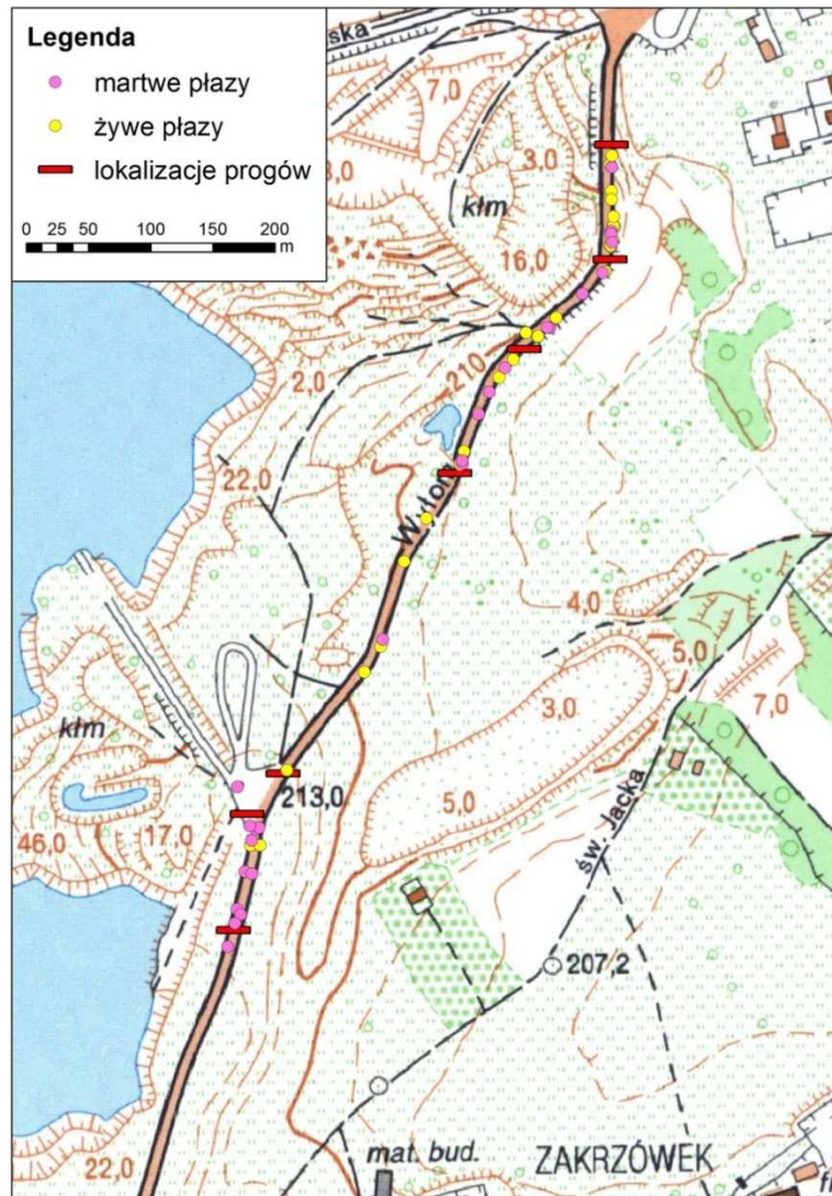
Ryc. 2. Rozmieszczenie miejsc stwierdzeń żywych i martwych płazów na ul. Wyłom w Krakowie w latach 2015-2019. Zaznaczono również proponowane miejsca, w których należałoby umieścić wariantowo progi zwalniające z przepustami dla płazów lub wyniesioną kładkę pieszo-rowerową na całej długości traktu pieszo-rowerowego na ul. Wyłom, co ograniczyłoby śmiertelność płazów na tym odcinku drogi.

Dwukrotne poszerzenie nawierzchni i zwiększenie przepustowości ulicy zwiększyłyby znacznie izolację siedlisk po obu stronach drogi, co miałyby bardzo negatywne konsekwencje dla wszystkich mało mobilnych organizmów, zwłaszcza dla wymiany genów dwóch subpopulacji gniewosza plamistego Coronella austriaca , co może mieć znaczący wpływ na kondycję i liczebność całej populacji gniewosza plamistego na Zakrzówku.